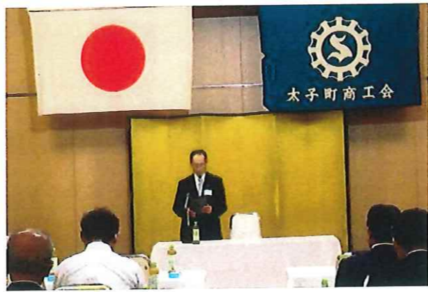
第67期(第66回)太子町商工会通常総代会