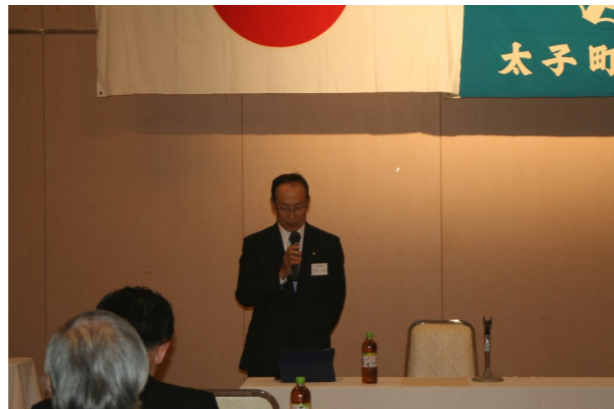
第65期(第64回)太子町商工会通常総代会